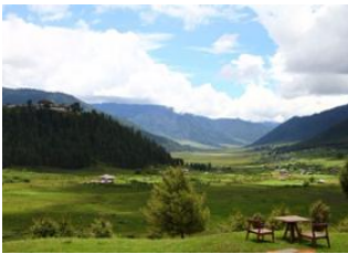
Thimphu 🚗 135km - ⌚ 5h 20m Phobjikha