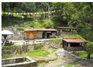
Warathang ♡ - ⌚ 5h Duer Tsachu ♡