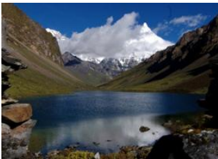
Woche 📍 17km - ⌚ 7h Lhedi 📍