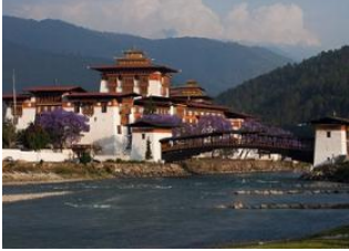
Jakar ♡ 🚗 210km - ⌚ 7h Punakha ♡