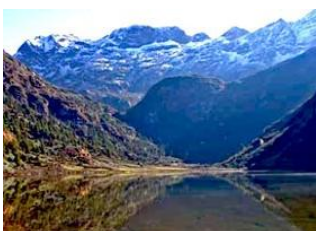
Narethang 18km - 6h Tarina