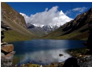
Jangothang 📍 18km - ⌚ 6h Lingshi 📍