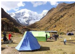
Geshe Woma ♡ - ⌚ 9h Warathang ♡