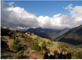
Tarina 📍 17km - ⌚ 7h Woche 📍