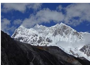
Gangkhar Puensum Base Camp 📍