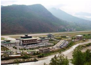
Aéroport de Paro 📍