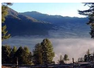
Duer Tsachu ♡ - ⌚ 9h Tsochenchen ♡