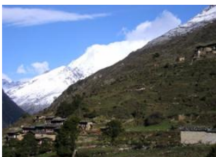
Rhoduphu 17km - 6h Narethang