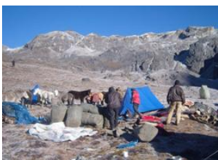
Chebisa 📍 17km - ⌚ 7h Shomuthang 📍