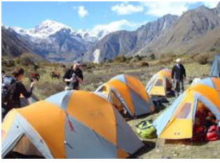
Shomuthang 📍 18km - ⌚ 7h Robluthang 📍