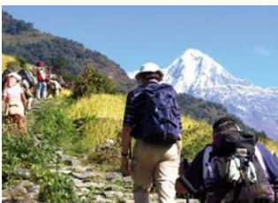
Lhedi 📍 17km - ⌚ 8h Thanza 📍