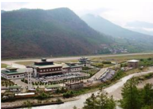
Aéroport de Paro ♡