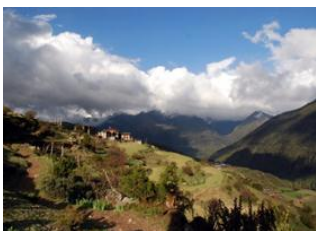
Laya 19km - 8h Rhoduphu