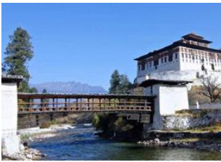
Punakha ♡ 🚗 200km - ⌚ 7h Paro ♡