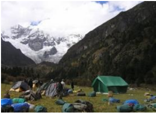
Robluthang 📍 19km - ⌚ 7h Limithang 📍