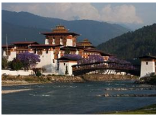
Thimphu 🚗 85km - ⌚ 3h Punakha