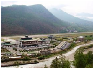
Thimphu 65km - ⌚ 2h 10m Paro Aéroport de Paro